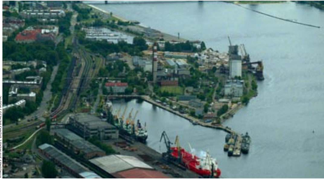
PIRMASIS Projektas "Vėjų rožė" - tai pirmasis plėtos projektas Baltijos šalyse, susijęs su daugiafunkcio uosto teritorijų plėtra abiejuose Dauguvos upės krantuose.